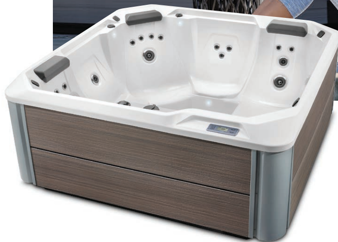
Con casco Alpine White y gabinete Havana.

Personas Asientos Jets Voltaje 5 Asientos Asiento Lounge 24 jets 115 V o 230 V