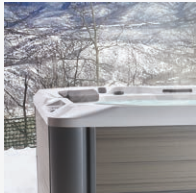
Aislamiento de alta densidad FiberCor®