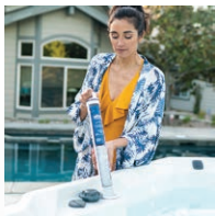
Cartucho listo en línea FROG® @ease®