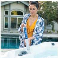
Cartucho listo en línea FROG® @ease®