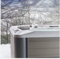
Aislamiento de alta densidad FiberCor®