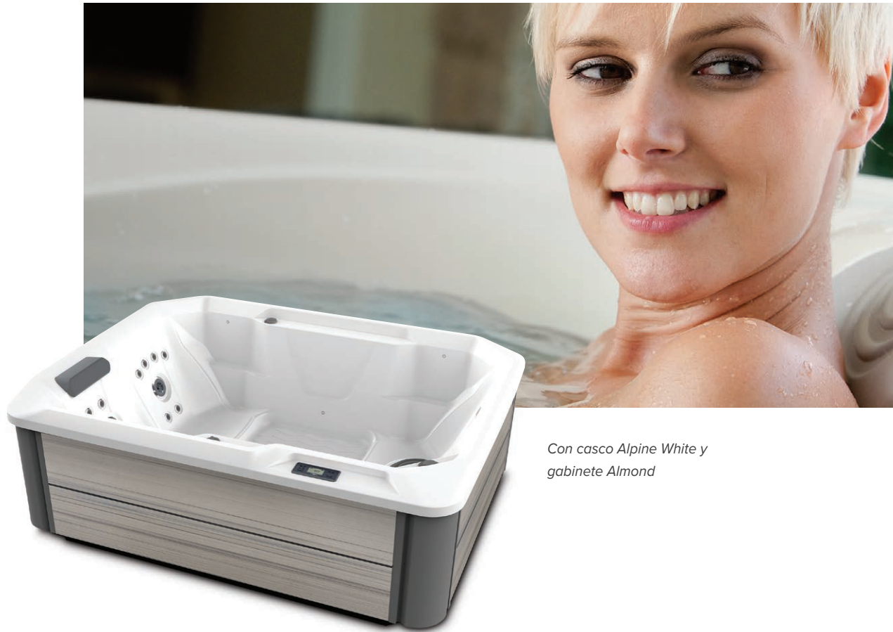
Con casco Alpine White y gabinete Almond

Personas Asientos Jets Voltaje 3 Asientos Asiento lounge 20 jets 115 V o 230 V