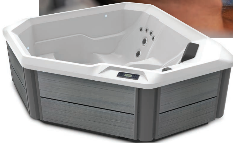
Con casco Alpine White y gabinete Storm.

Personas Asientos Jets Voltaje 2 asientos Sin Asiento Lounge 11 jets 115 V o 230 V